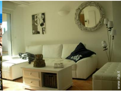
Comfort interno ed attrezzature