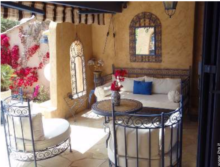
Casa di Charme