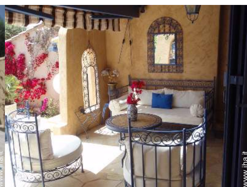
Casa di Charme