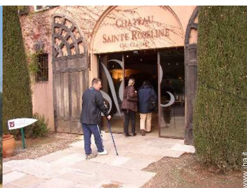
cantina e degustazione di vino