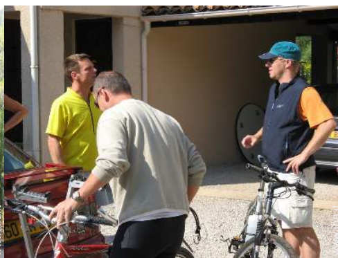
percorso per mountain bike