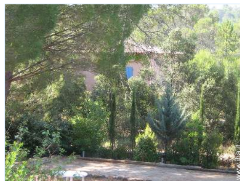
campo di bocce