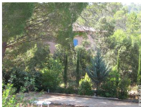
campo di bocce