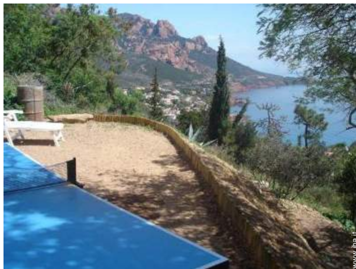
tavolo da ping-pong