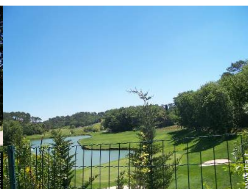
percorso di golf 18 buche