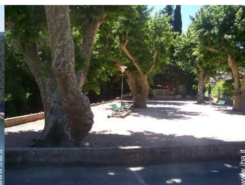
campo di bocce