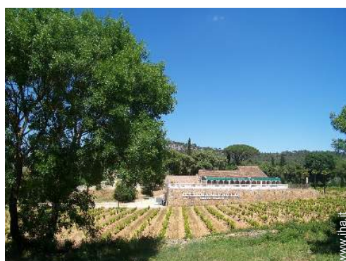
cantina e degustazione di vino