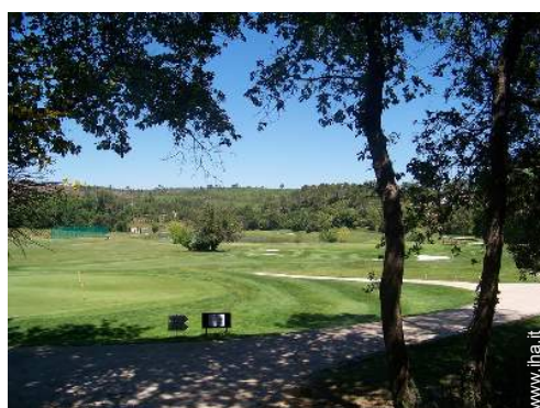
percorso di golf 18 buche