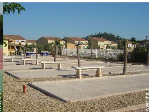
campo di bocce