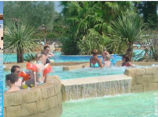
Piscina a sfioro