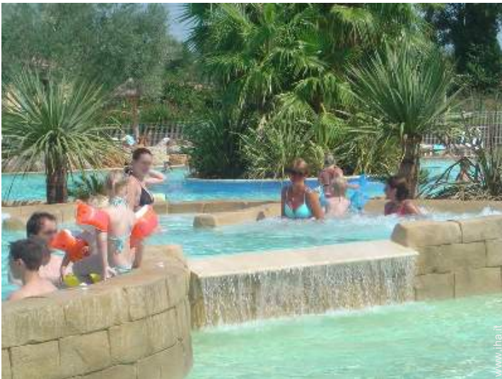
Piscina a sfioro