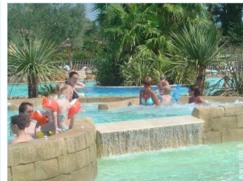
Piscina a sfioro

- Centro città 800m - Panetteria 300m - Traiteur 1km - Negozi tipici 1km - Supermercato 2km - Salone di coiffure 1km - Ufficio postale 1,5km - Banca 1km - Distributore automatico di biglietti 1km - Farmacia 1km - Medico 1km - Ospedale 10km