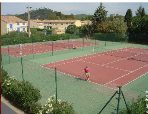
campo da tennis in comune