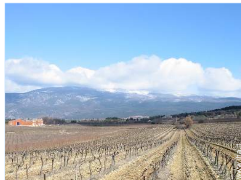
vista sui vigneti