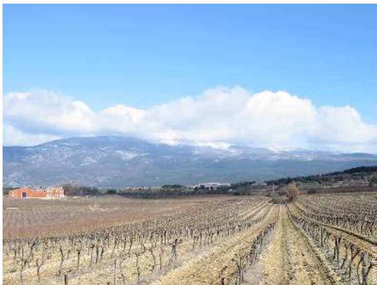
vista sui vigneti