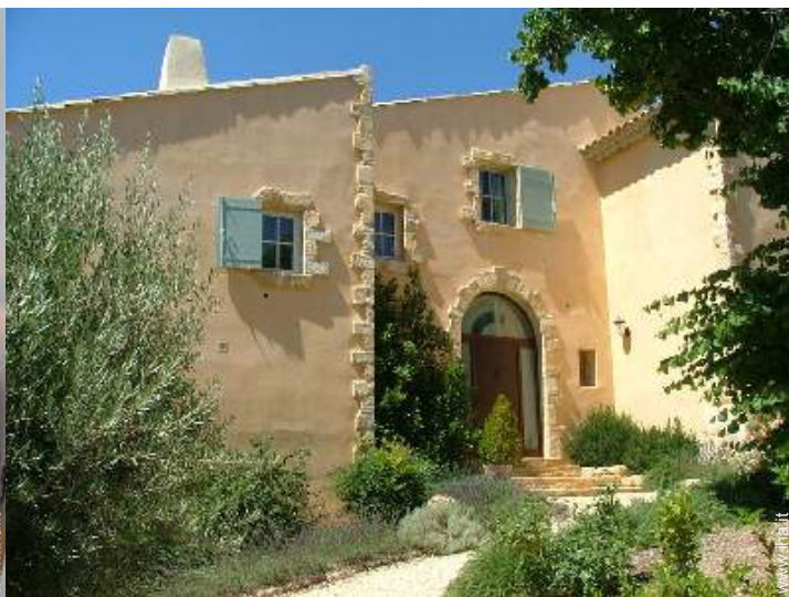
Casa Provenzale di Lusso