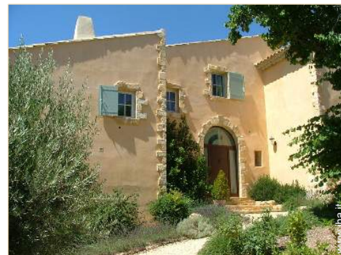
Casa Provenzale di Lusso