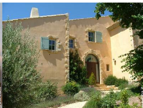
Casa Provenzale di Lusso