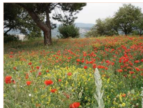
vista sulla campagna