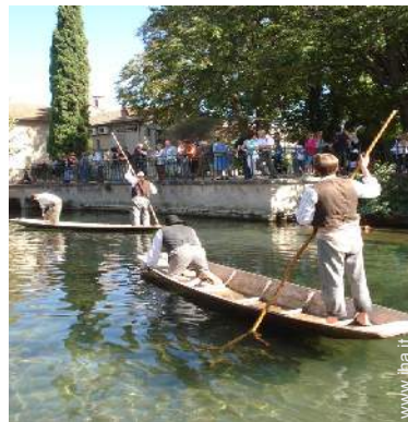
Attrazioni e relax