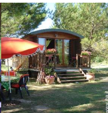
Roulotte di Charme