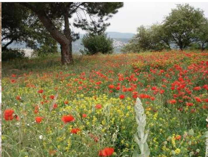
vista sulla campagna