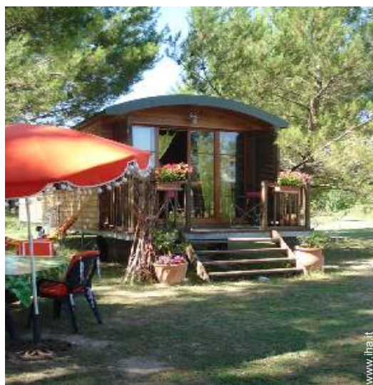
Roulotte di Charme