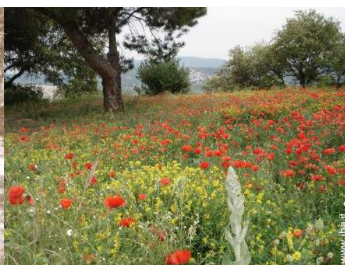
vista sulla campagna