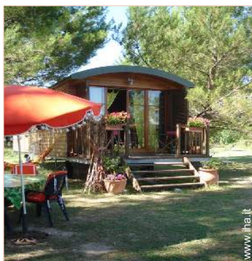
Roulotte di Charme