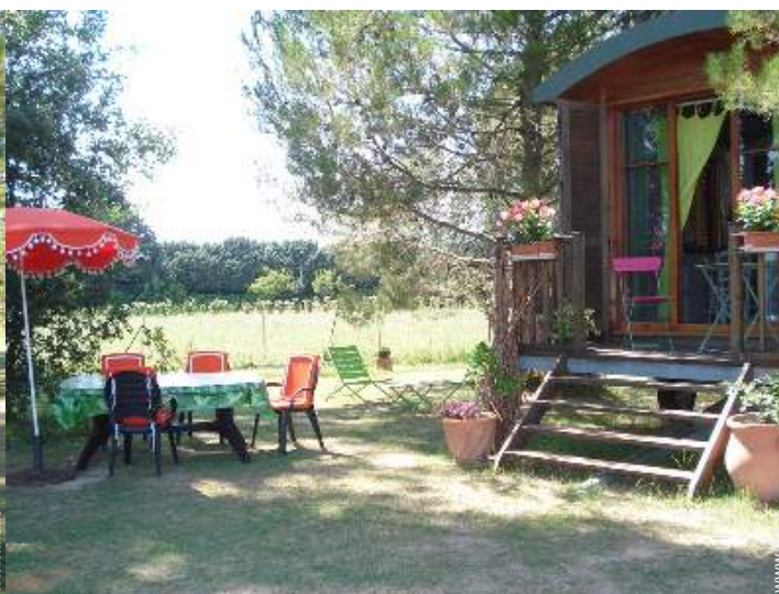
vista sulla campagna