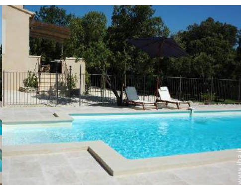
piscina per bambini