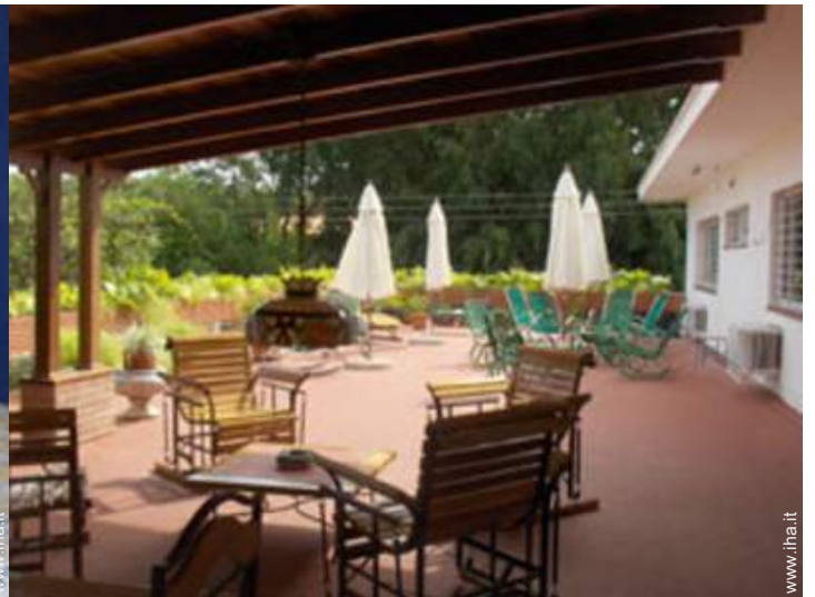
Attrezzature a disposizione