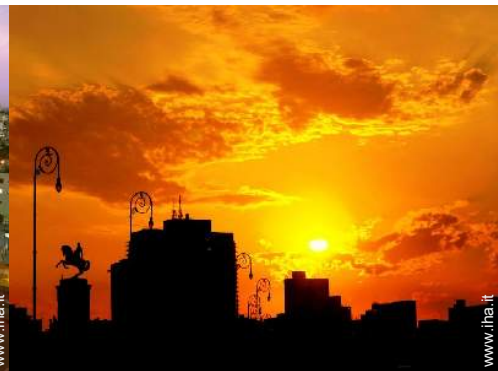
vista sul monumento