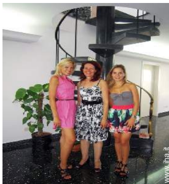
Il vostro ospite