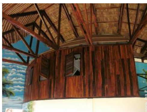
stanza degli ospiti