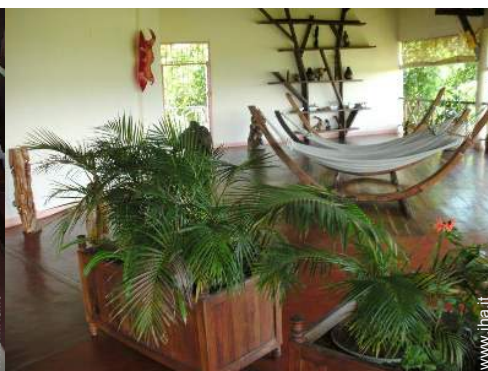
Attrezzature a disposizione