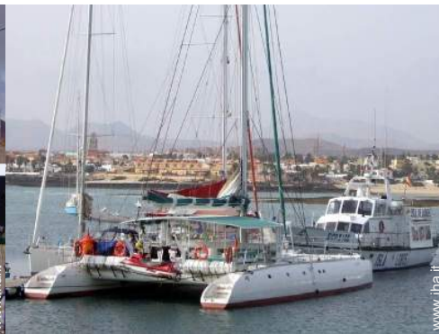
escursione in barca