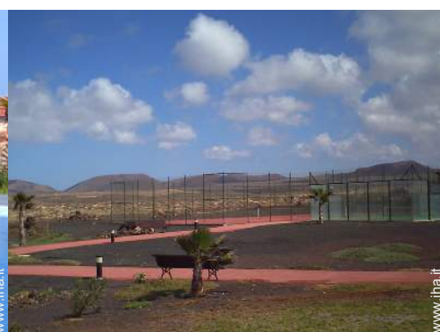
Tennis - superficie sintetica