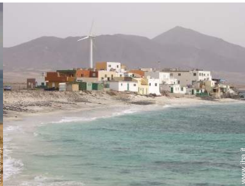
spiaggia dei nudisti