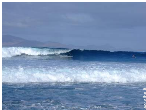
punto di surf