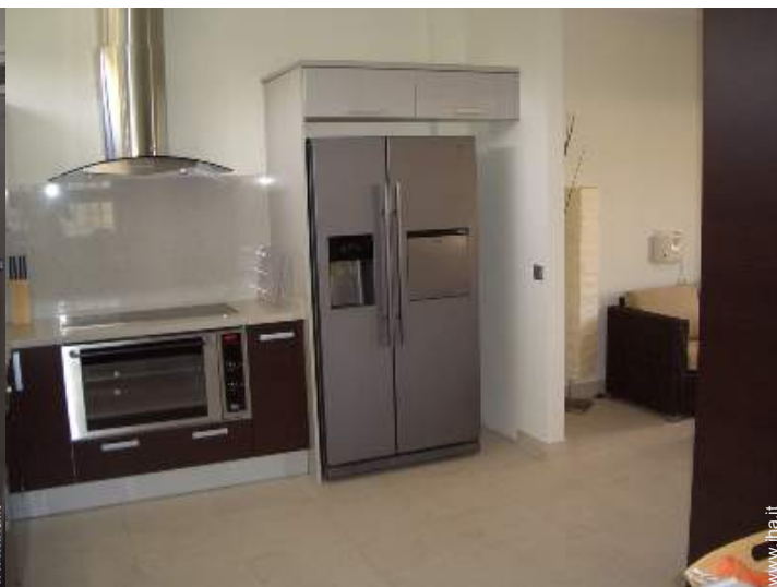
macchina del ghiaccio