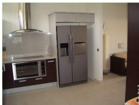
macchina del ghiaccio