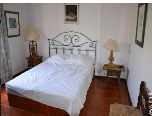
stanza degli ospiti