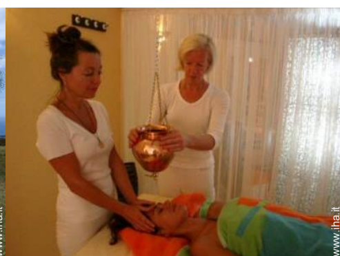
trattamenti di bellezza