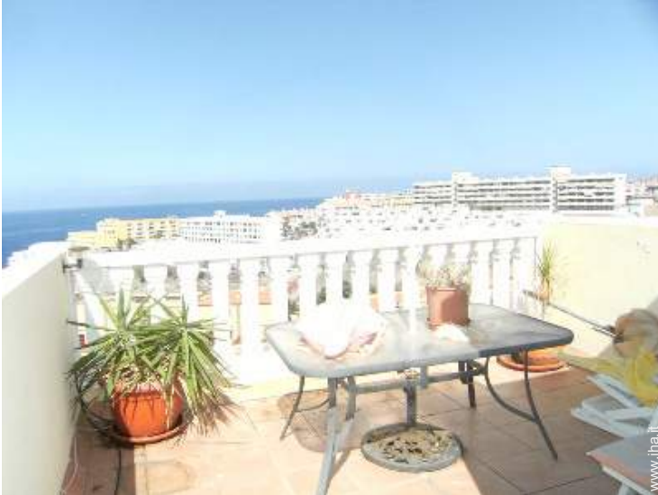
terrazzo sul tetto