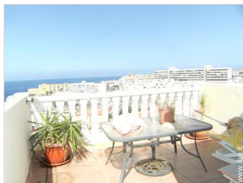
terrazzo sul tetto

Privilegi : Accesso diretto alla spiaggia