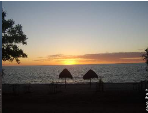
vista sul tramonto