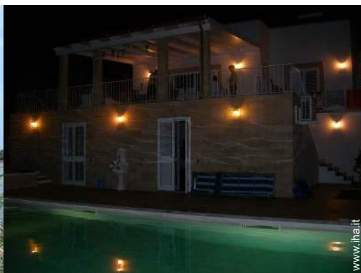
sistema di illuminazione