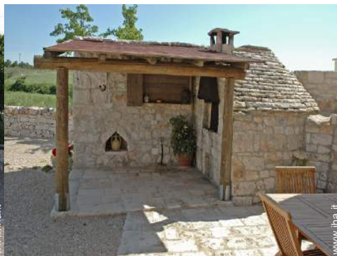
forno per pizze