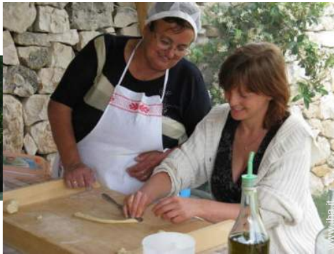
preparazione pasti tipici