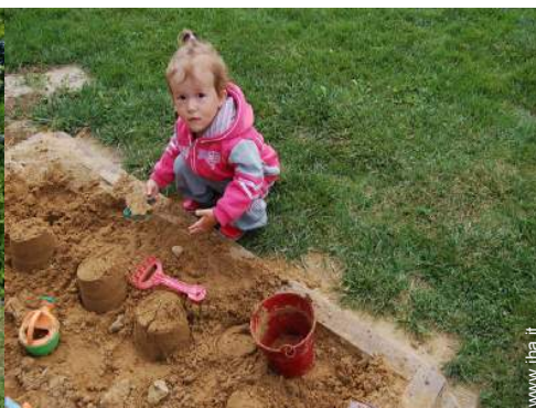
vasca per la sabbia