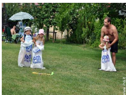
vista sul prato