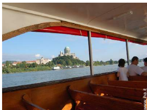
escursione in barca