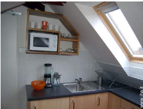
utensili e batteria da cucina