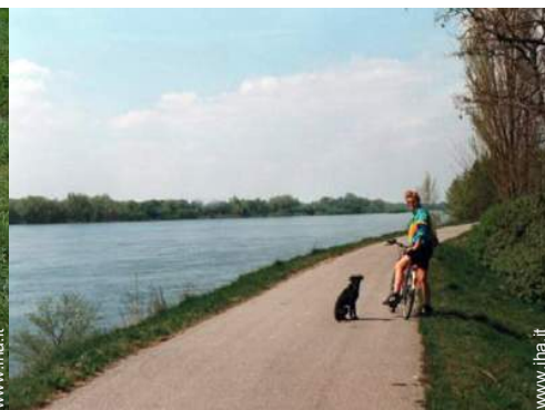
sport estivi nelle vicinanze