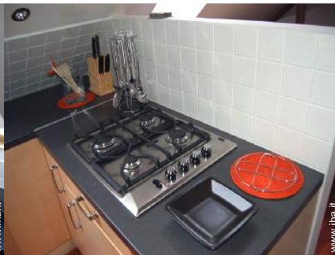
cucina a gas