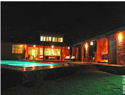
sistema di illuminazione