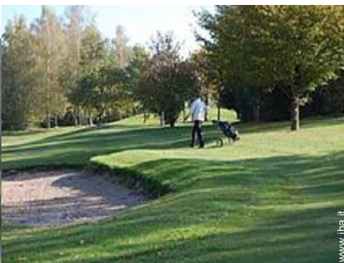
percorso di golf 18 buche