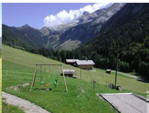
struttura rampicante per bambini