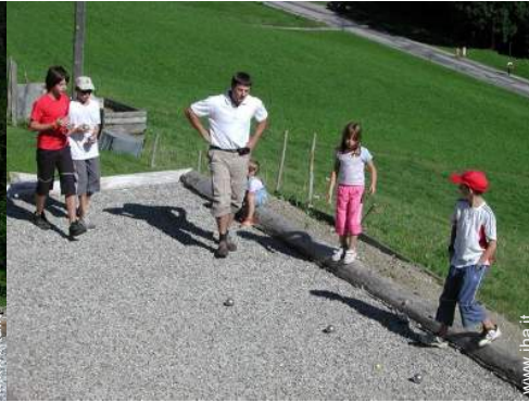
campo di bocce