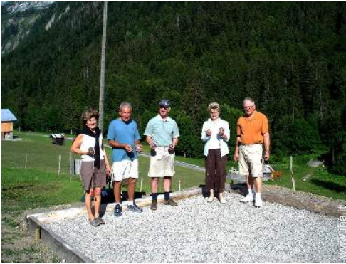
campo di bocce