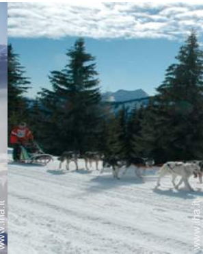
slitta con i cani