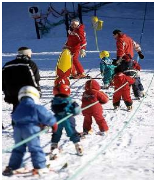
scuola di sci