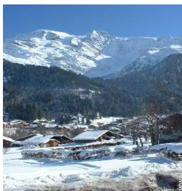
attività montane nelle vicinanze