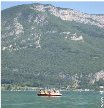
escursione in barca