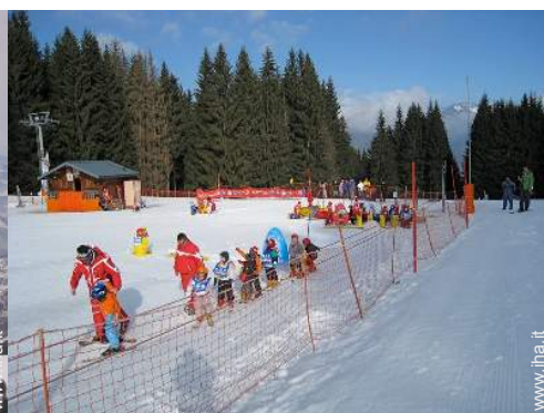
giardino delle nevi per bambini