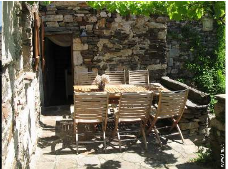
sedia(e) da giardino