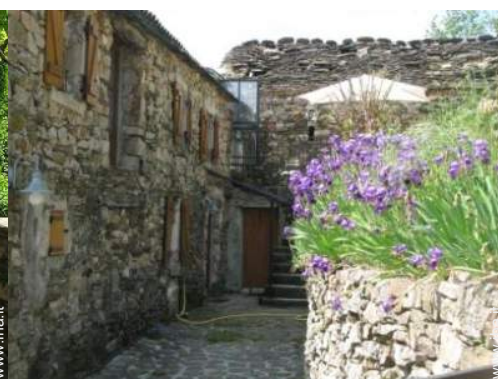
Dimora in Pietra di Charme