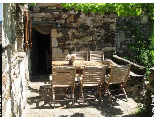
sedia(e) da giardino