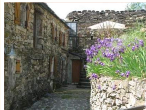
Dimora in Pietra di Charme

- Villaggio centro 2,5km - Centro città 25km - Fermata/stazionamento bus 25km - Panetteria 25km - Traiteur 25km - Negozi tipici 25km - Supermercato 25km - Salone di coiffure 25km - Internet café 25km - Ufficio postale 25km - Banca 25km - Distributore automatico di biglietti 25km - Farmacia 25km - Medico 25km - Infermiera 25km - Ospedale 50km