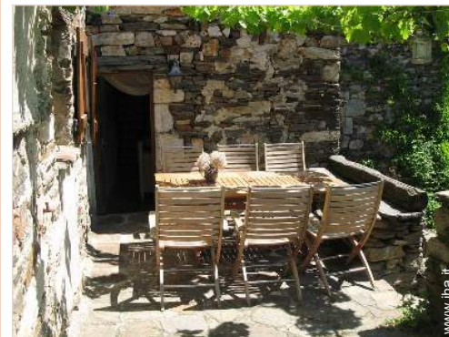
sedia(e) da giardino