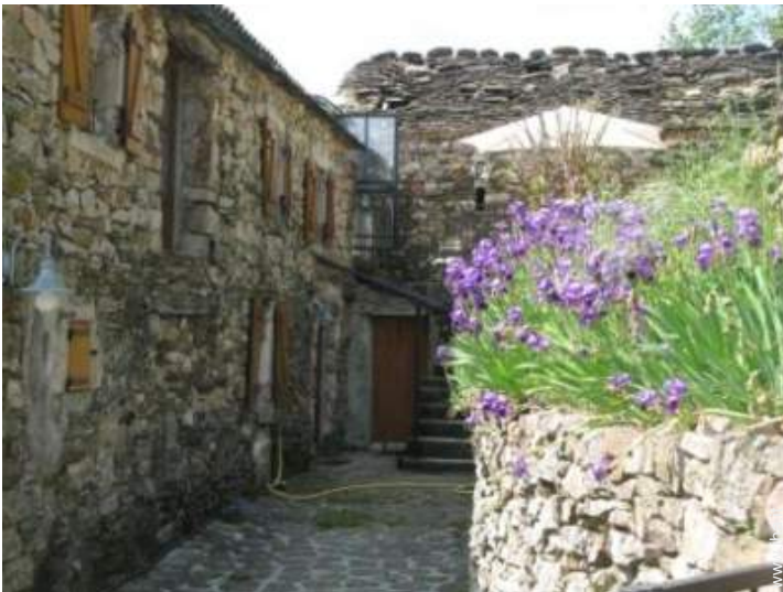
Dimora in Pietra di Charme