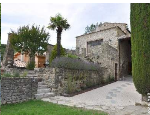
Casa Provenzale di Lusso