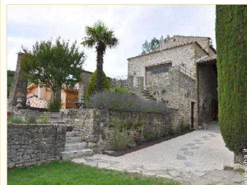
Casa Provenzale di Lusso