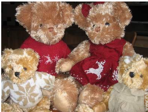
I vostri ospiti