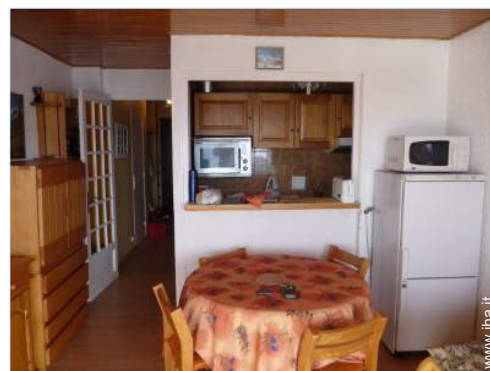
Disposizione interna e confort

Tavolo da giardino, 5 sedia(e) da giardino