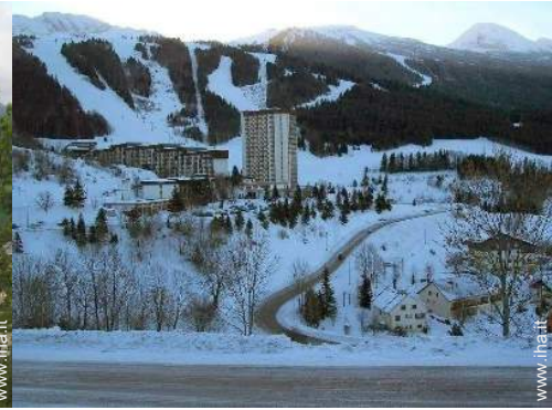
piste di sci