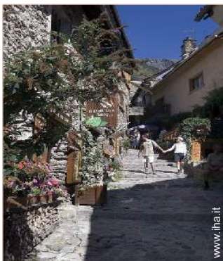
vista sulla strada pedonale