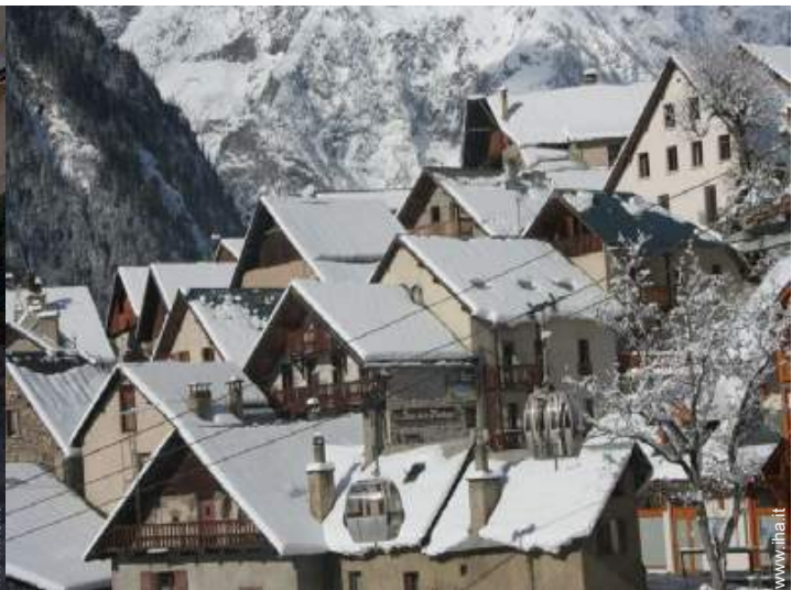
vista sul villaggio