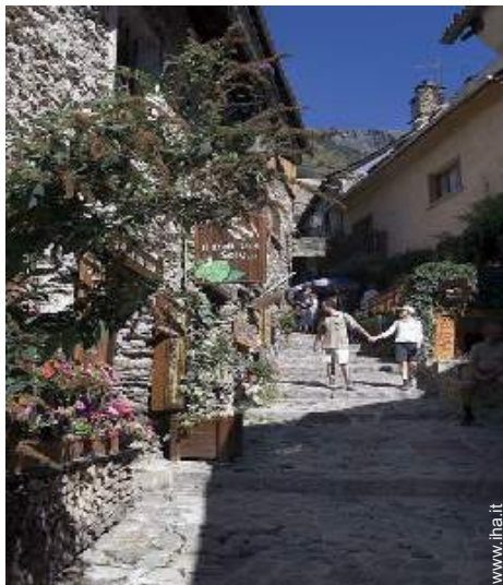
vista sulla strada pedonale