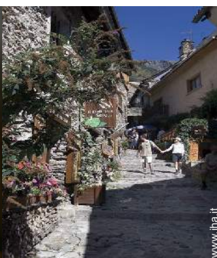
vista sulla strada pedonale