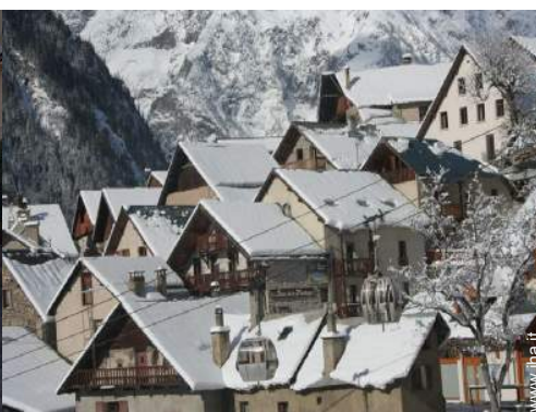
vista sul villaggio