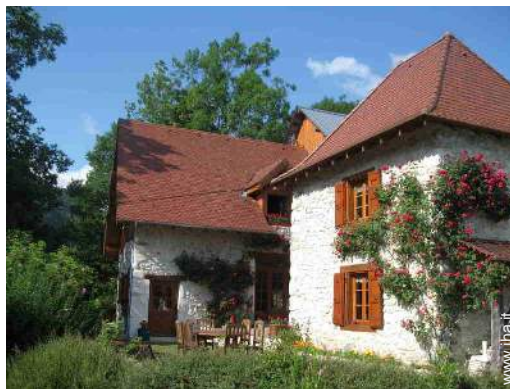
Casa in Pietra di Charme