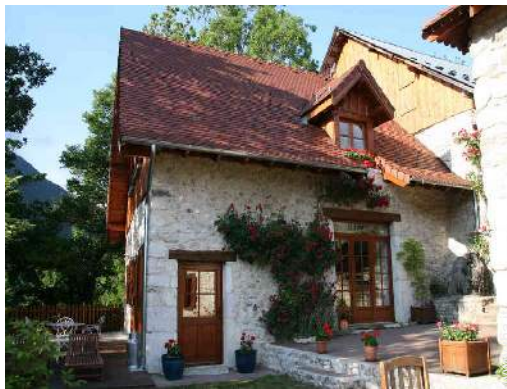
Casa in Pietra di Charme