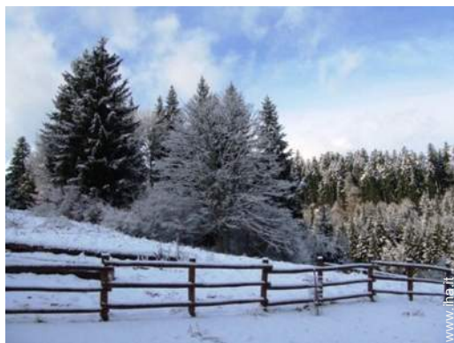
vista sulla foresta