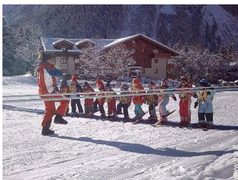
scuola di sci