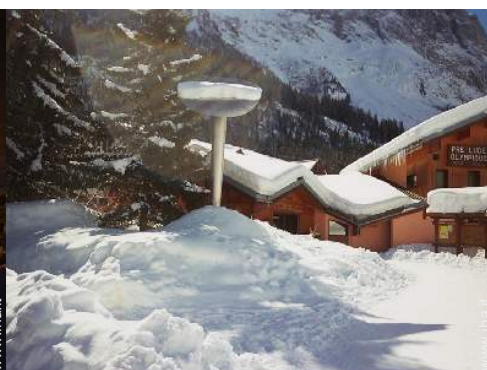
pattini da ghiaccio