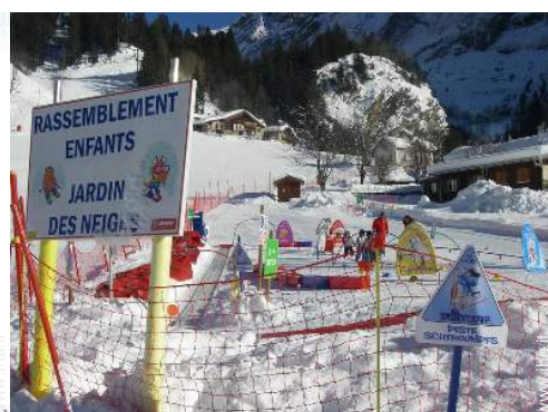
giardino delle nevi per bambini