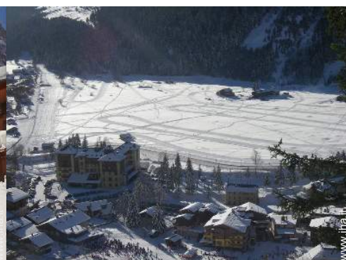
sci fuori pista