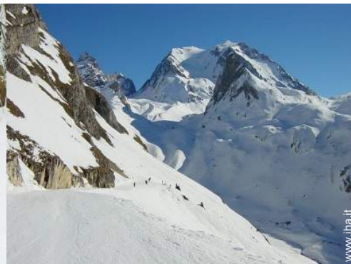
piste di sci