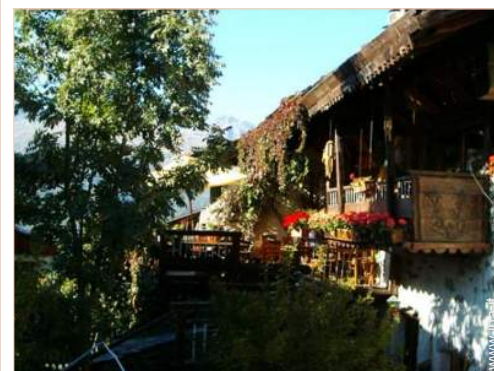
Chalet in Legno di Charme