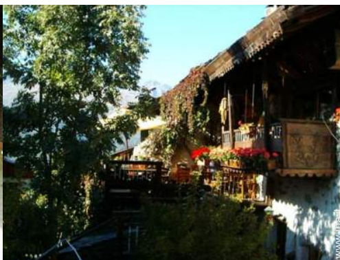
Chalet in Legno di Charme