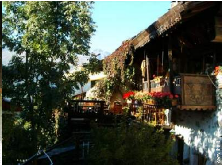
Chalet in Legno di Charme