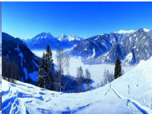
piste di sci