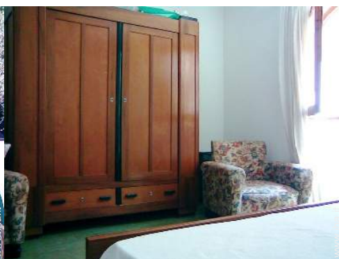
Comfort interno a disposizione degli ospiti