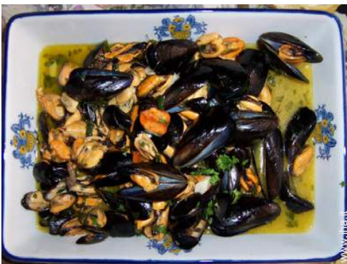
preparazione pasti tipici