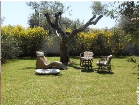
vista sul prato