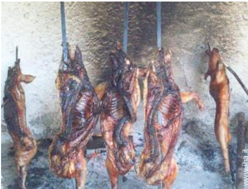
preparazione pasti tipici