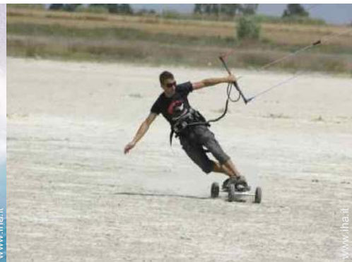
attività di volo nelle vicinanze