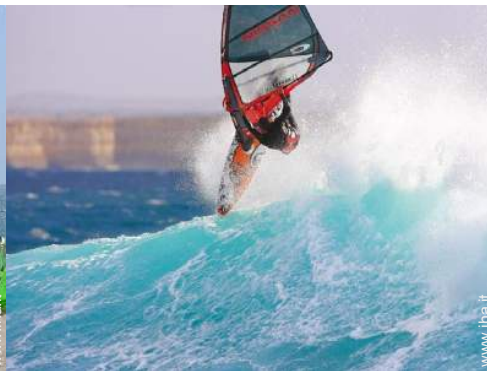
sport acquatici nelle vicinanze