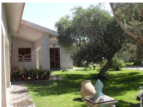
vista dal patio