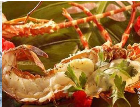
preparazione pasti tipici