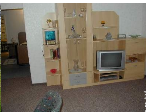
Disposizione interna e confort