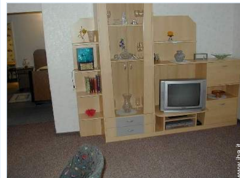
Disposizione interna e confort