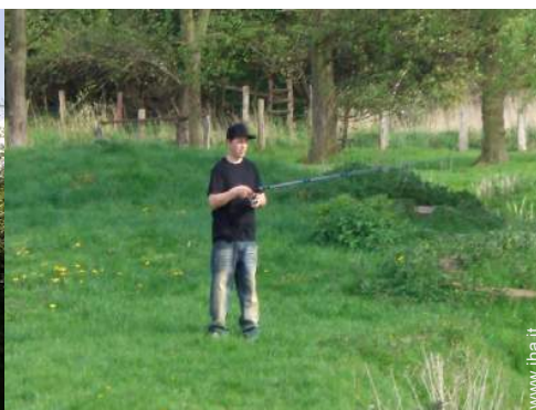
pesca con lenza