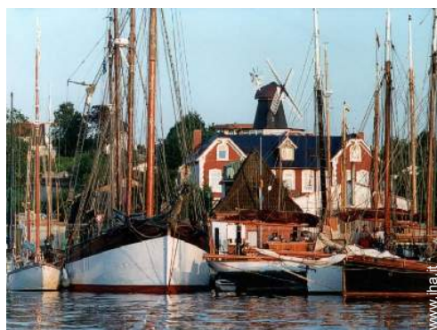
sport motorizzati nelle vicinanze