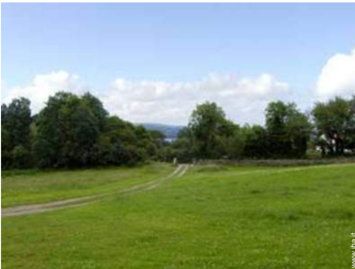
vista sui campi agricoli