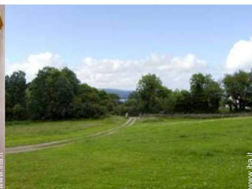
vista sui campi agricoli