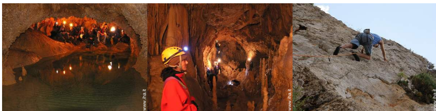
attività montane nelle vicinanze