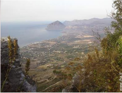
percorso per mountain bike