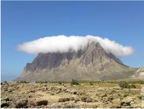
arrampicata su roccia