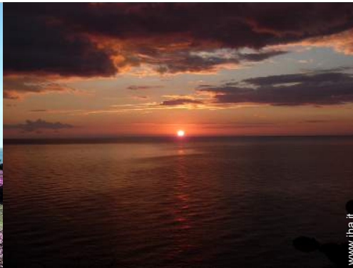
vista sul tramonto