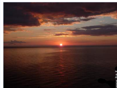
vista sul tramonto