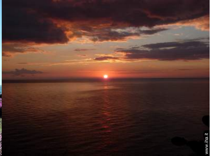
vista sul tramonto