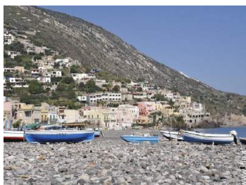
spiaggia con ciotoli