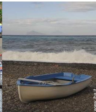
spiaggia con ciotoli