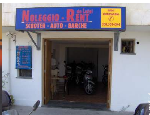
noleggio di moto/scooter