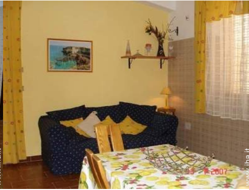
divano(i) letto 2 pers