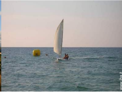
barca a vela